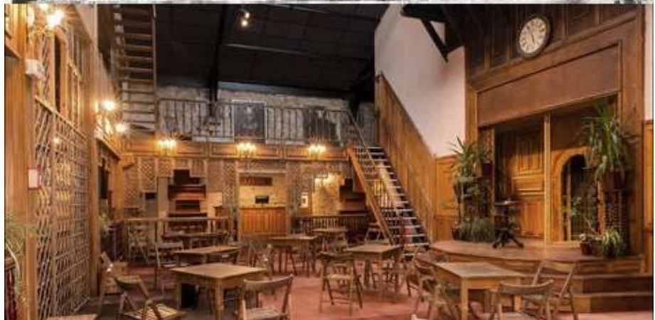
Le Théâtre de tréteaux et son mur de fond de scène. Inspiration du décor / Hall de L'Épée de Bois.