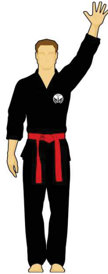
Schéma 8c : « Combattant rouge touche la cible C, 5 points »