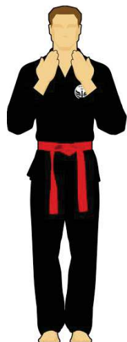
Schéma 5 : « Faute technique »