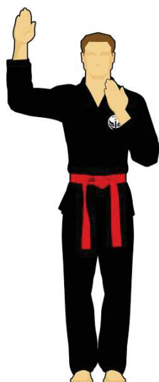
Schéma 13 : « Faute ! »

Le combattant vert est sorti de l'arène de combat en mettant les deux pieds dehors de façon intentionnelle. Les points reviennent au Combattant rouge.