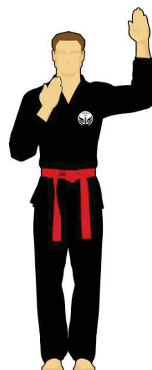
Schéma 14 : « Faute ! »

Le combattant vert vient de faire une faute passible d'un avertissement ou d'une sanction.