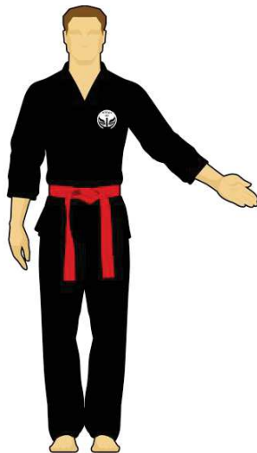
Schéma 9 : « Sortie de l'arène non intentionnelle » Le combattant rouge est sorti de l'arène de combat en mettant les deux pieds dehors de façon non intentionnelle (bousculade).