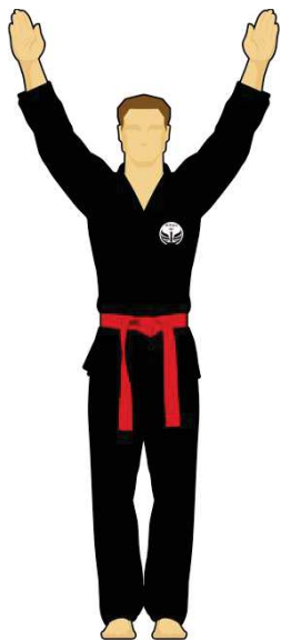
Schéma 15 : « Cessez ! » L'arbitre demande l'arrêt du combat. Il peut s'ensuivre d'autres gestes d'arbitrage pour expliquer l'arrêt.