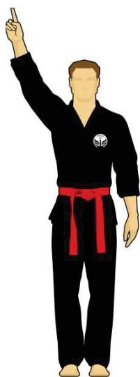
Schéma 7a : « Combattant vert touche la cible A, 1 point »