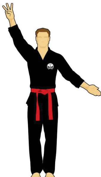
Schéma 11 : « Sortie de l'arène »

Le combattant rouge est sorti de l'arène de combat en mettant les deux pieds dehors de façon intentionnelle. Les points reviennent au Combattant vert.