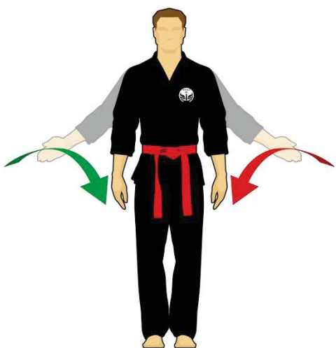
Schéma 3 : « Combattez »