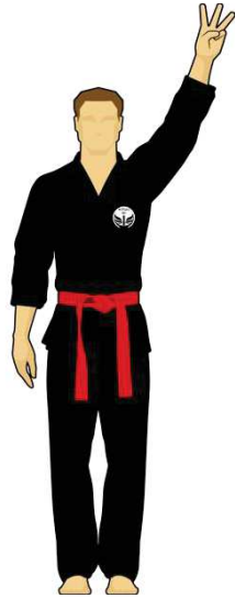
Schéma 8b : « Combattant rouge touche la cible B, 3 points »