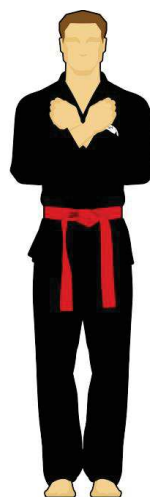
Schéma 4 : « Abstention », indécision de l'arbitre. Il n'a pas vu la faute ou la touche