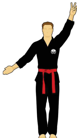
Schéma 12 : « Sortie de l'arène »

Le combattant rouge est sorti de l'arène de combat en mettant les deux pieds dehors de façon intentionnelle. Les points reviennent au Combattant vert.