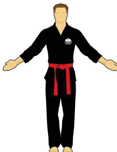
Schéma 2 : « Êtes-vous prêt ? »