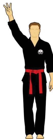
Schéma 7b : « Combattant vert touche la cible B, 3 points »