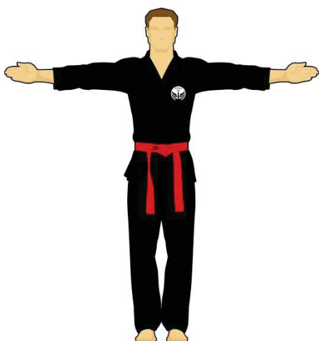
Schéma 1 : « Saluez-vous » ou « En Garde » ou « Saluez les arbitres »